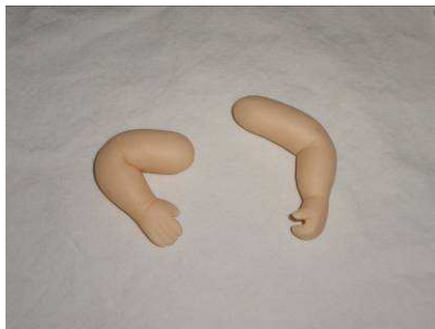
Modeler les bras , Plier, marquer les doigts et les plis