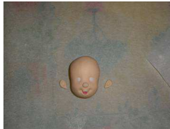
Enfoncer les yeux, modeler les oreilles, collez sur la tête