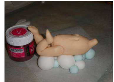
coller les jambes au corps soutenir contre un appui