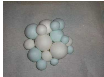
Modeler des boules bleues et bla les coller en «nuage »