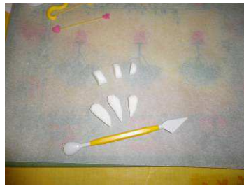
former les ailes, strier dans la longueur et laisser durcir