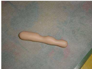
Modeler les jambes