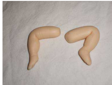
Plier et marquer les articu- lations et les orteils.