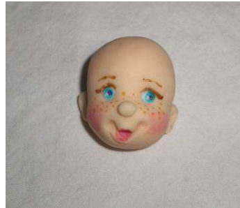
peindre le visage rosir les joues