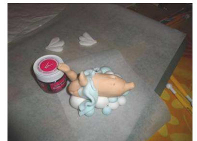
Étaler et coller le linge bleu Sur les fesses en le faisant plisser