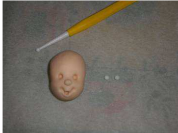
Modeler le visage, creuser Les orbites, la bouche, Coller le nez.