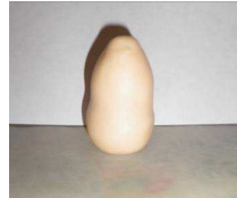
Modeler le corps